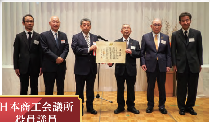
永年勤続表彰を受賞した方々