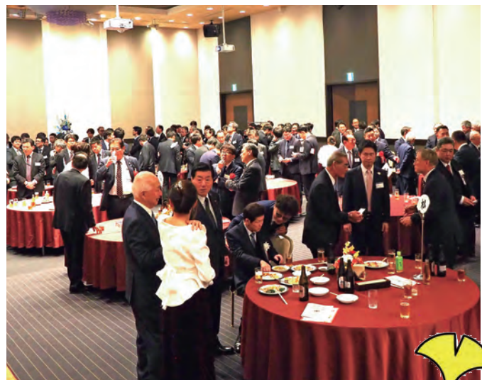
令和8年新春賀詞交歓会