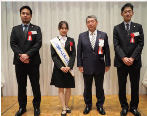
JEF市原千葉(右)、VONDS市原(左)のリーグ昇格を祝う、ちばポートアンバサダー(中央)と会頭