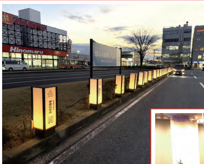
姉ヶ崎駅東口イルミネーション