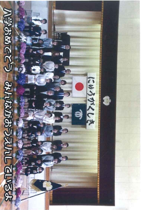
入学おめでとう みんなががっくえんしてらびだ

加茂園は、新たに1名の1年生を迎え、今年度のスタートを切りました。4月1日(火)に行われた入学式では、来賓・保護者の皆様、上級生たちの見守る中、呼名に元気よく返事する新入生の姿が印象的でした。