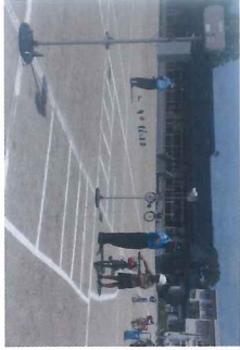
交通安全教室の様子

4月21日(月)、市原市役所地域連携推進課と南総交通安全協会の皆様を講師にお招きし、1年生・4年生・7年生を対象として交通安全教室を行いました。グラウンドに道路や踏切を見立てたコースを設けて、実際に歩行・横断したり、自転車で行ったり、交通安全を確認することができま