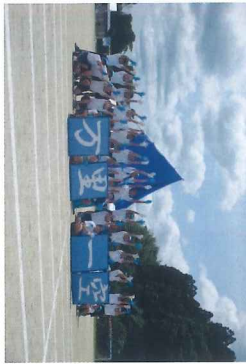
敷地内を散策の様子

6月20日(月)、1・2年生は「どんな生き物があるか探そう」というテーマで、敷地内を散策して回ることにしました。