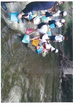
鮎の稚魚を放流する体験学習の様子

老川漁協組合の方の御指導のもと、1・2年生が鮎の稚魚を放流する体験学習を行いました。加茂地区の豊かな自然と命の尊さを感ずる貴重な体験となりました。