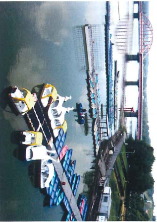
高滝湖観光企業組合