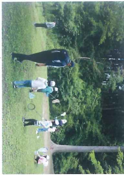
遠山山通信(遠山山通信)

2年生は「おはなすの森」へ校外学習に行きました。1年生は「みんなが使う公園にはどんなものがあろうか」というテーマで、敷地内を散策して回ることにしました。