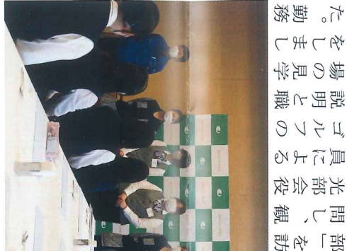
ゴルフ場見学の様子

た。勤務している先輩方から社員の心構えや就業内容、体験などのお話を伺いました。その後フロントやエッセイ、厨房など普段入れない場所を見学させていただきました。