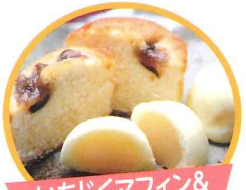
いちじくマフィン & 銀杏まんじゅう