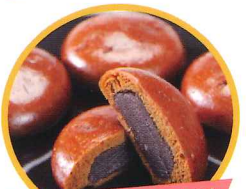
牛久饅頭 八坂太鼓