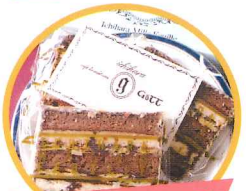
市原ミルクフィーク