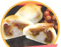
いちじくまんじゅう