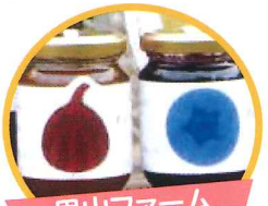
里山ファーム いちじくジャム