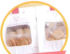
シーモッククッキー