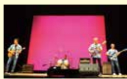
⑤牛久ベンチャーズ