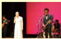
③right before nikko