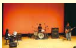
④DOG HOUSE FACTORY