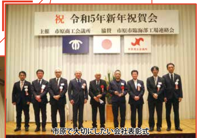
市原で大切にしたい会社表彰式