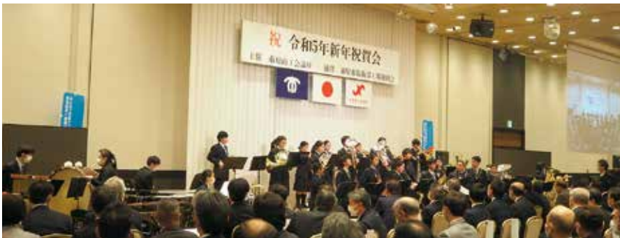
東海大学付属市原望洋高等学校 吹奏楽部による演奏

ガンに事業所が抱えている様々な課題や変化をタイムリーに察知、中小企業のイノベーション創出と付加価値向上を通じた成長支援をサポートしていくと語りました。また、昨年50周年を迎えられた感謝の気持ちを持ちながら、SDGsやカーボンニュートラル等の環境対策についても理解を深め、市原