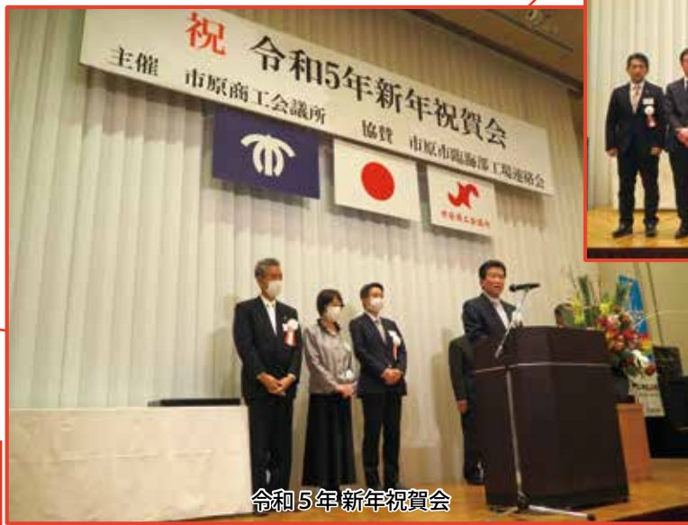
令和5年新年祝賀会