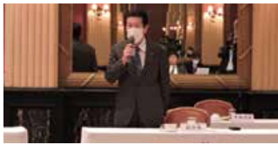
千葉県商工会議所連合会 榊原副会長 (当所会頭)

デジタル人材の自社（社内）育成に取り組み企業に対して、IT化・デジタル化に向けた取組を着実に実施できるように、補助金・助成金など直接的支援も含め拡充すること。