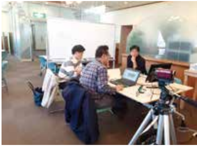
ブランディング戦略で相談者とIT専門家をつなぎました

コワーキングスペース(共同で仕事をする場所)の一面を持つ本センターでは現在、フリーランスや起業前の人達の仕事場として、また交流や情報交換の場として新たなビジネスチャンスのきっかけづくりに活用いただく方も多くいます。そして、この場の出会いで仕事にむすびついた事例もいくつもあります。ビジネスにつながる年代、立場が違ふ人とのコミュニケーション