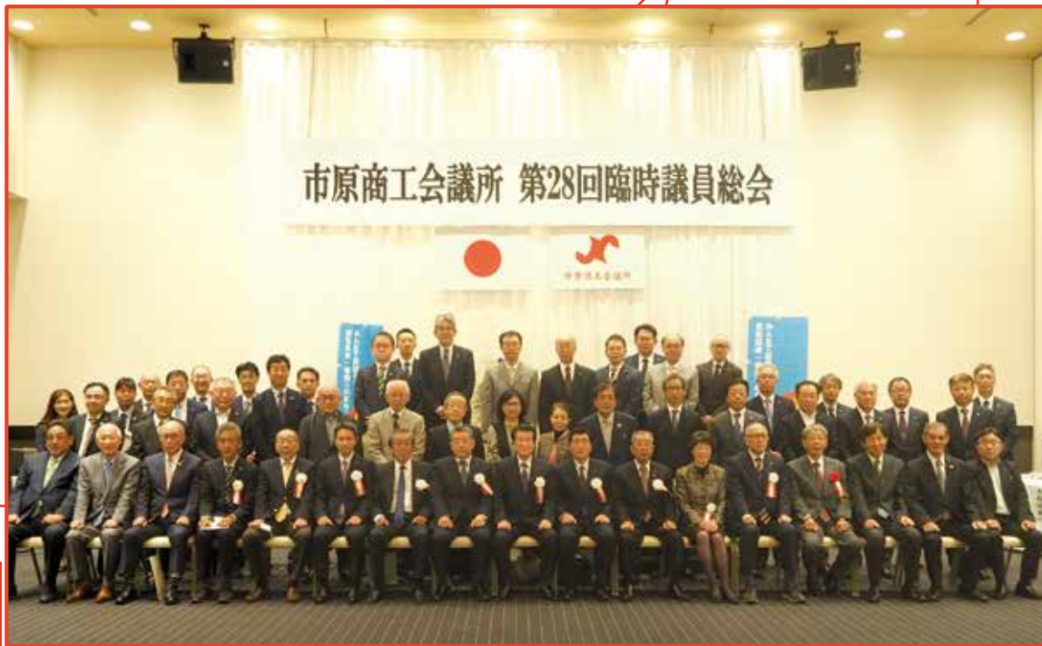
第28回 臨時議員総会