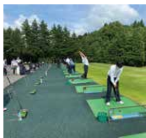
6月3日 浜野ゴルフクラブ