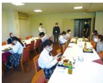
6月4日 市原京急カントリークラブ