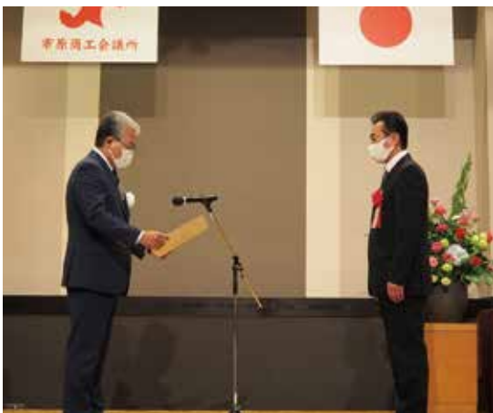
特別賞 一宮運輸(株)関東支社 ▲