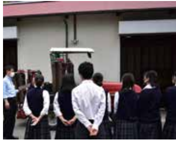
6月2日 姉ヶ崎カントリー倶楽部