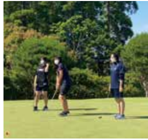
6月1日 千葉よみうりカントリークラブ