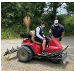
6月3日 南総カントリークラブ