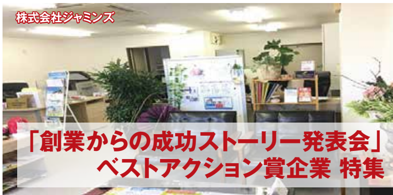
来店しやすい店内を心掛けています ▲