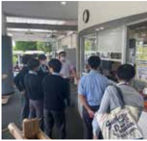
6月1日 源氏山ゴルフ倶楽部