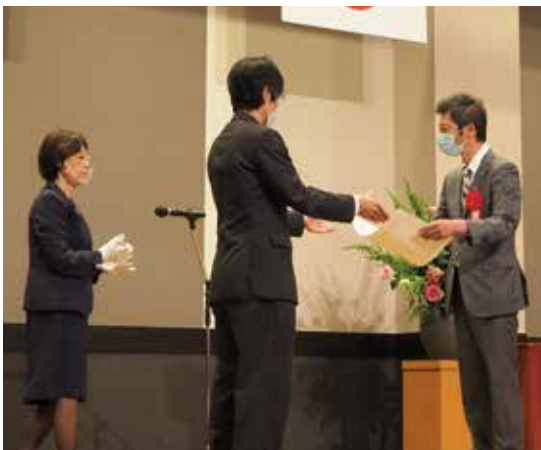
奨励賞 (有)常陽機設 ▲

市原商工会議所が主催する「市原で大切にしたい会社表彰」とは、経営理念をしっかりと持ち、経済環境に翻弄されることなく、従業員、取引先、お客様、地域社会を大切にしたい「思いやりの経営」を実践する事で持続発展する企業を表彰するものです。 5名の審査員による厳正なる審査により、第4回受賞企業を3社選出しました。 大賞には日本データマテリアル(株)、特別賞(市原市長