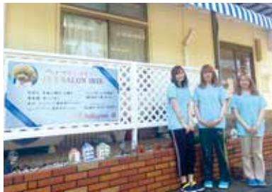
株式会社ジャミンズ