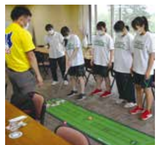
6月4日 CPGカントリークラブ