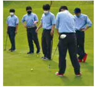
6月2日 ゴルフ5カントリーオークビレッジ

午後は支配人の挨拶、スタッフからゴルフ場コースの説明を受けた後、パター練習や遠くへ飛ばすレンジ練習、実際に1コースを回る等、ゴルフの難しさを感じながらも広い敷地の中