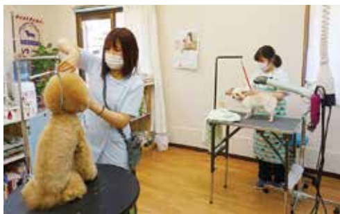
運営するトリミングサロン「IRIE」 ▲