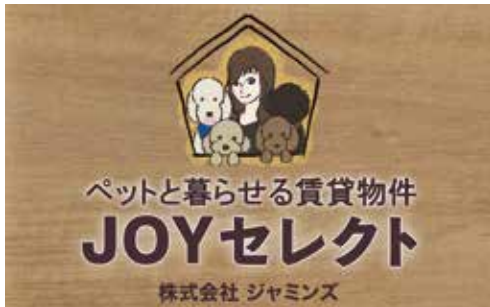
ペットと暮らせる物件を「JOYシリーズ」として紹介 ▲