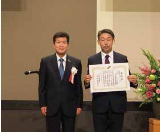
大賞 日本データマテリアル(株) ▲